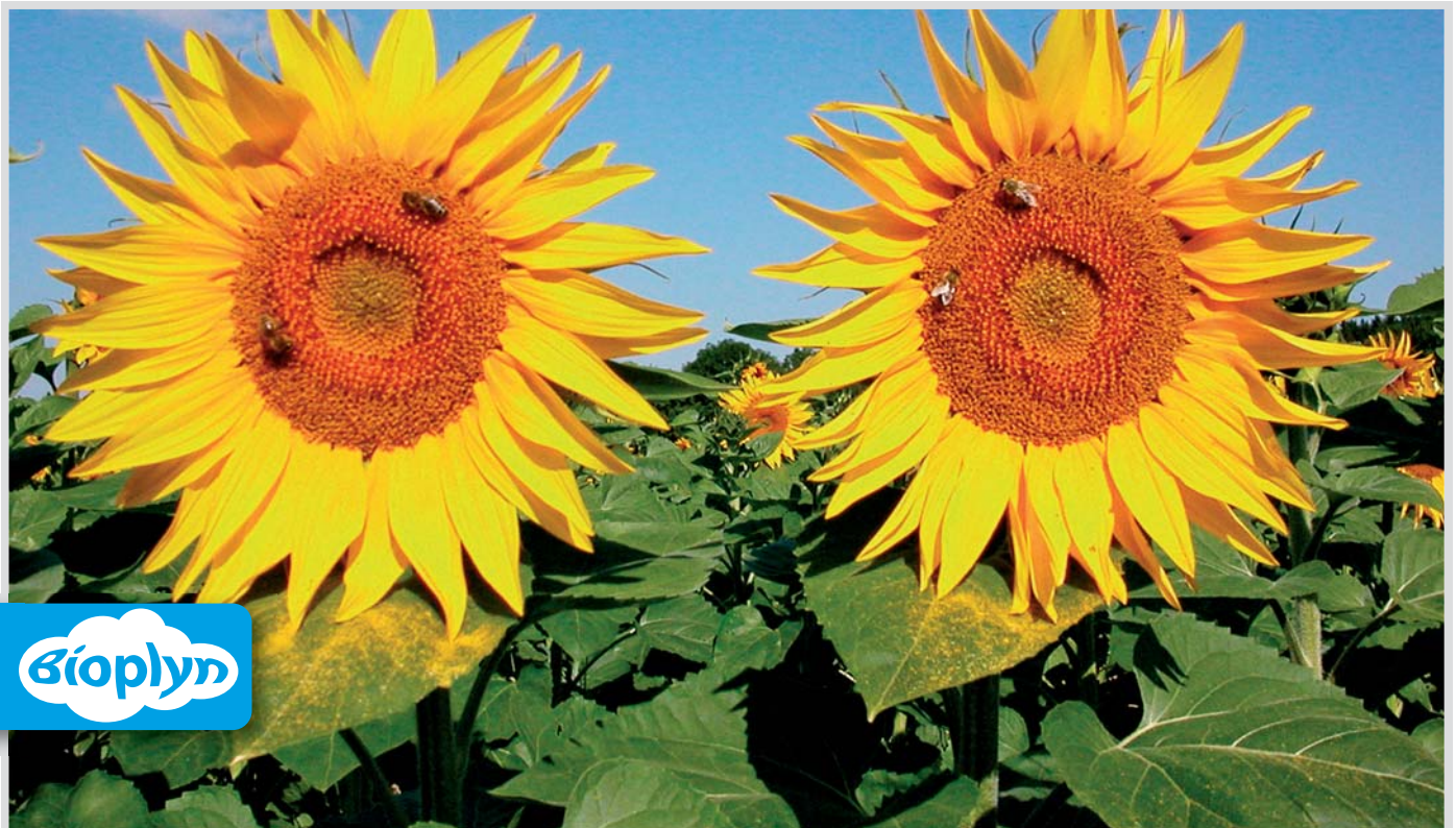
Slničnica – alternatívna energetická plodina