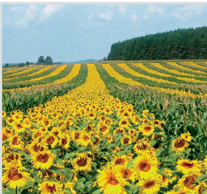
Bioplyn systém v praxi