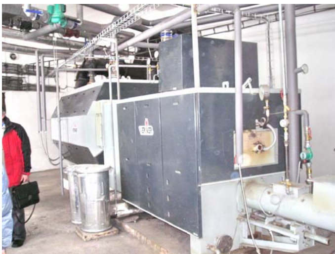
Obr. 5 Kotol na drvenú slamu o výkone 600 kW

Slama sa dostáva do kotla cez podávač, posúvač a protipožiarne zariadenie . Okrem slamy môže byť v kotly spaľovaný aj iný druh biomasy, napríklad drevná štiepka a rôzne pelety a brikety z biomasy. Kotol má inštalovaný výkon 600 kW. Investície predstavovali 7 000.- Sk na jeden inštalovaný kW. Technológia spaľovania drvenej slamy je vhodná okrem vykurovania aj na ohrev vzduchu v sušiarensťve.