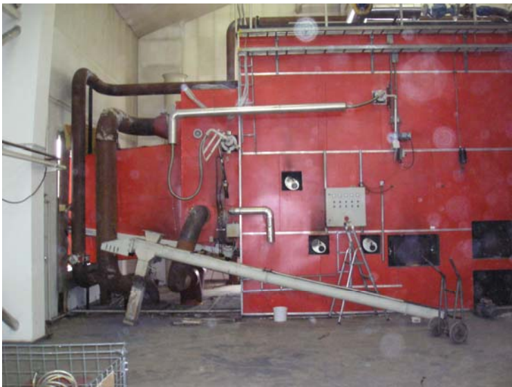
Obr. 2 „Cigaretový“ kotol v obci Schkößen (Nemecko)

Spaľovanie celých balíkov slamy v tzv. „cigaretových“ kotloch – tento druh kotlov je určený pre väčšie spaľovne, hlavne v komunálnej sfére pri vykurovaní obcí alebo sídlisk. Sú používané okrem Dánska aj v Nemecku a Škandinávii. Ich inštalovaný výkon je nad 1 MW.