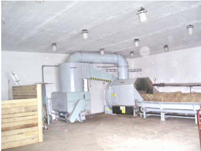
Obr. 4 Dopravník balíkovej slamy s rozdrúžovačom

Spaľovanie rozdrúzenej slamy – Táto technológia spaľovania slamy je kontinuálna a spaľuje sa slama podrvená na veľkostné frakcie 2 – 50 mm. Celá linka pozostáva s dopravníka balíkovej slamy, ktorý zabezpečuje nepretržitú dodávku slamy do rozdrúžovača (obr. 4), kde je slama drvené a ďalšími dopravnými a manipulačnými zariadeniami privádzaná do kotla (obr. 5). Na Slovensku je prvý kotol tejto konštrukcie v prevádzke prvú vykurovaciu sezónu v obci Turňa nad Bodvou. Kotolňa zásobuje teplom 28 bytov a tri budovy miestnej školy.