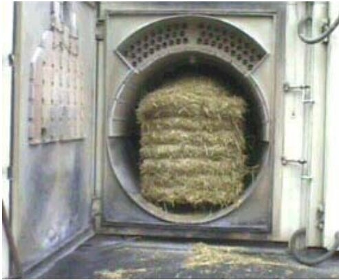
Obr. 1 Pohľad do spaľovacieho priestoru kotla na veľké valcovité balíky.

Spaľovanie celých balíkov slamy v tzv. „cigaretových“ kotloch – tento druh kotlov je určený pre väčšie spaľovne, hlavne v komunálnej sfére pri vykurovaní obcí alebo sídlisk. Sú používané okrem Dánska aj v Nemecku a Škandinávii. Ich inštalovaný výkon je nad 1 MW.