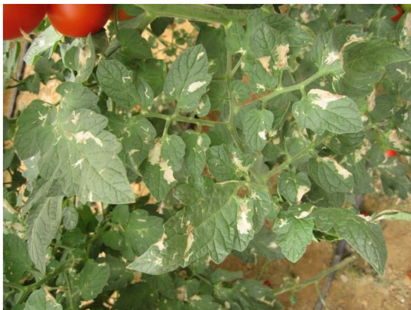
Míny na listoch rajčiaka