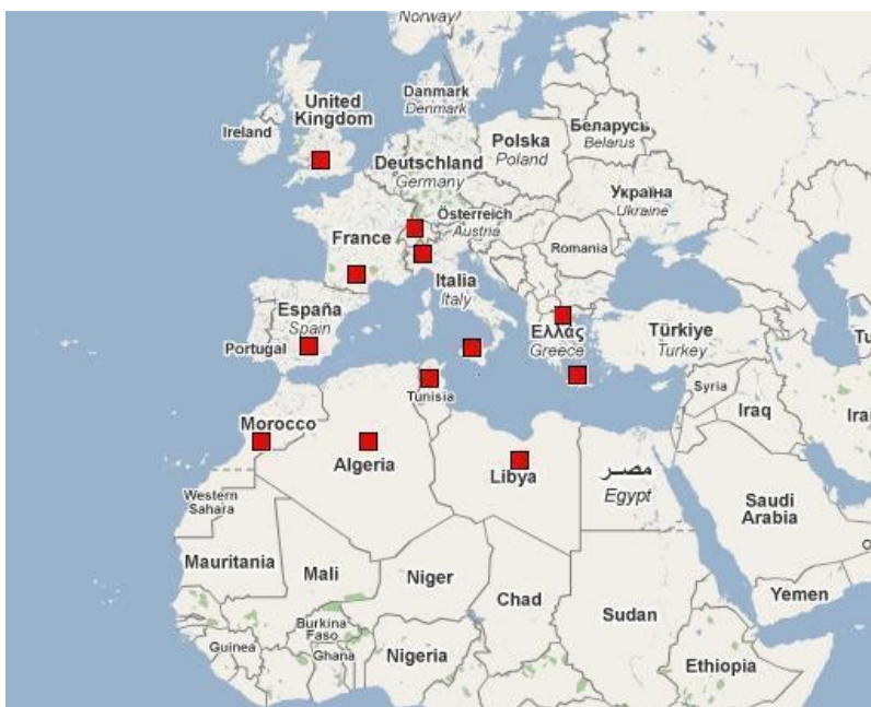
Štáty s výskytom, rok 2009

Tuta absoluta sa šíri veľmi rýchlo v mnohých štátoch v celom pobreží Stredozemného mora . Tento škodca teraz predstavuje vážnu hrozbu pre produkciu skleníkových rajčín v tomto regióne.