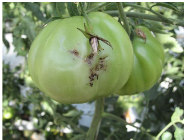
Zdroj sekundárnej infekcie

Na listoch spôsobujú požerky v podobe charakteristických nepravidelných mín. Listové pletivo v okolí mín nekrotizuje a pri silnom napadnutí môžu usychať celé rastliny. Vnútri stoniek a v plodoch vyžierajú chodbičky. V tesnej blízkosti poškodenia sú vždy zreteľné kopčeky s tmavým zrnitým trusom. Znečistený povrch rastlín je zdrojom sekundárnych patogénov. Tuta absoluta nepatrí medzi regulované škodlivé organizmy. Tento škodca nie je schopný prezimovať v chladnejších oblastiach mierneho podnebného pásu (okrem skleníkov), napriek tomu existuje reálna hrozba zavlečenia a jeho rozširovanie do ďalších členských krajín EÚ, predovšetkým prostredníctvom dovozu hostiteľských rastlín zo štátov s preukázaným výskytom Tuta absoluta .