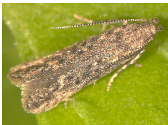
Dospelý jedinec škodcu