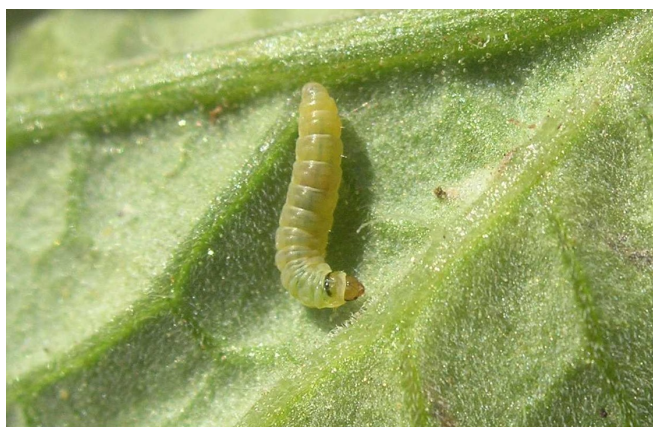
Húsenica na liste

Tuta absoluta má nenápadné šedohnedé sfarbenie. Rozpätie krídel je 10 mm. Pre psoty sú typické dlhé a hore pretiahnuté tykadlá, ktoré sú dobre viditeľné voľným okom. Škodlivým štádiom sú húsenice , ktoré prechádzajú štyrmi larválnymi štádiami. Spočiatku sú larvy belavej farby, neskôr sa sfarbujú do zelenej až ružovej. Majú tmavo hnedú hlavu a na predohrudi výrazný čierny prúžok. Dorastajú do veľkosti až 8 mm. Vývojový cyklus trvá 29 až 35 dní. Minimálna a maximálna teplota, pri ktorej môže škodca dokončiť svoj vývoj, je 14 a 30°C. Táto juhoamerická psota má veľký reprodukčný potenciál, v skleníkoch vytvára 10 až 12 generácií za rok. Samičky škodcu sú schopné naklásať 200 až 300 vajíčok.