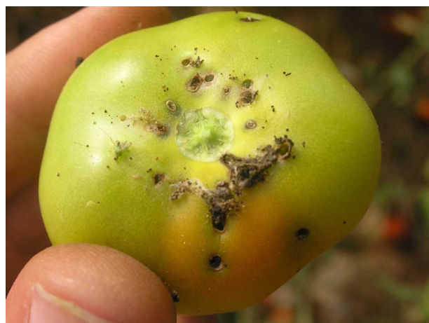
Kopčeky trusu na plode