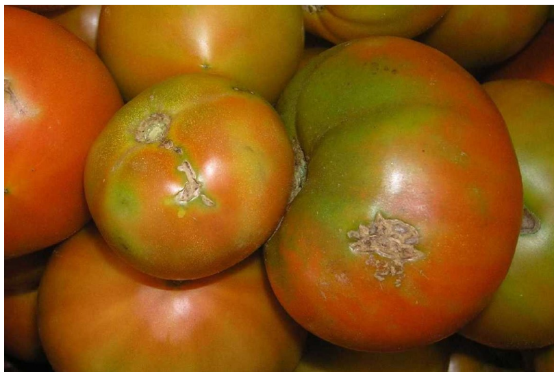
Požerky húseníc na plodoch

Húsenice škodia žerom najmä na zelených častiach rastlín, ale môžu poškodzovať aj plody. Výrazne znižujú úrodu a kvalitu plodov.