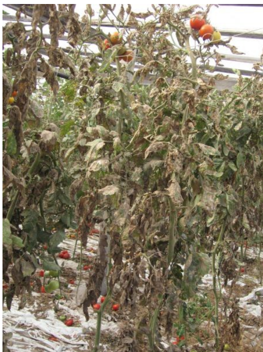
Napadnuté celé rastliny

Odporúčanie pre pestovateľskú prax je preventívna samokontrola skleníkových rajčiakov celoročne viackrát (aj v zime). Taktiež treba sledovať stav fóliovníkových a poľných rajčiakov v priebehu roka v mesiacoch máj až september. Po vizuálnom zistení podozrivých rastlín alebo plodov rajčín je potrebné okamžite kontaktovať príslušného oblastného fytoinšpektora odboru ochrany rastlín Ústredného a kontrolného ústavu poľnohospodárskeho. Telefónne čísla fytoinšpektorov je možné nájsť na internetovej adrese: http://www.uksup.sk/index.php?n=29A .